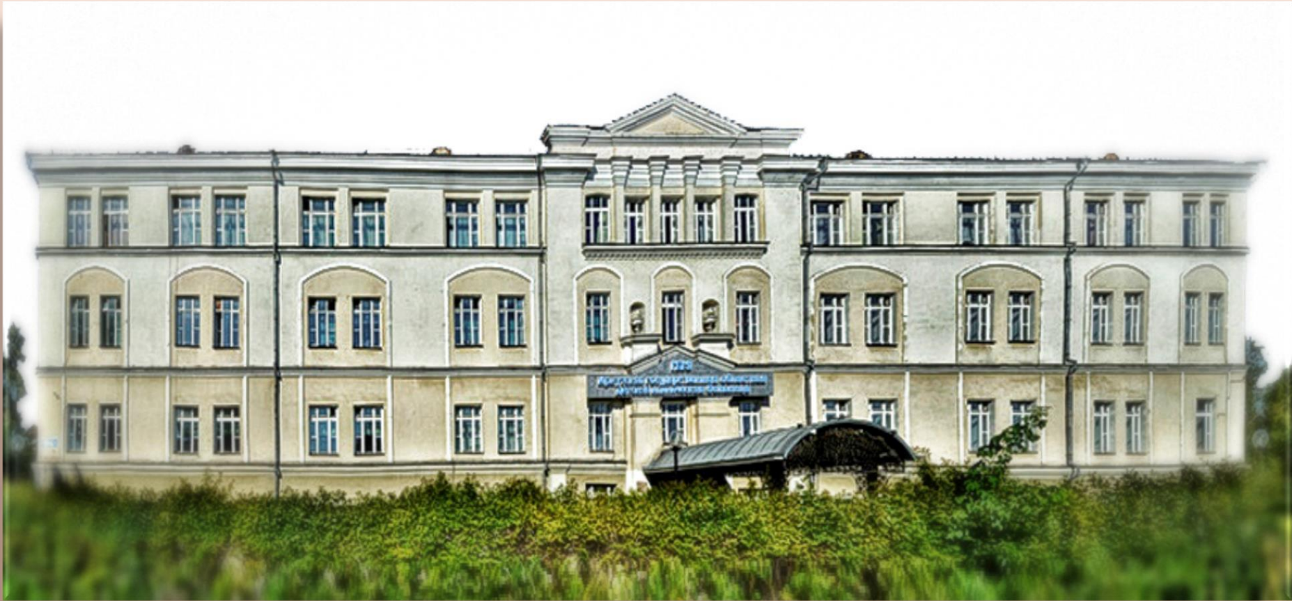
Иркутская государственная областная детская клиническая больница